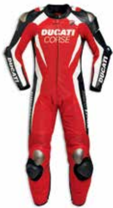
Ducati Corse K3