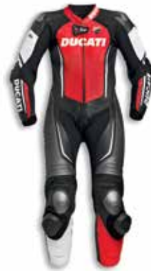
Ducati Corse |D |air C2 LADY