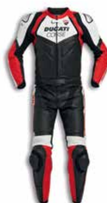
Ducati Corse C5 spezzata / two pieces