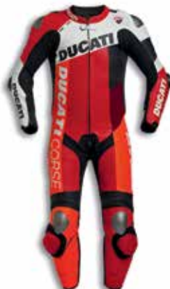
Ducati Corse C6