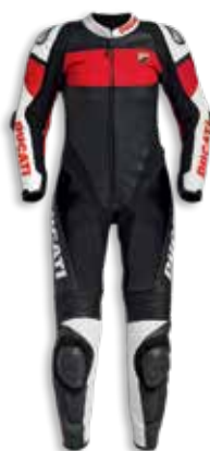
Ducati Corse C5 Lady