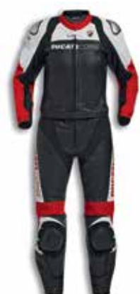
Ducati Corse C5 Lady spezzata / two pieces

Tutti i modelli sono disponibili sia in versione perforata che non perforata.