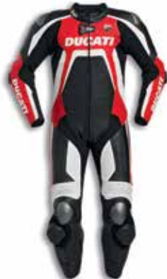
Ducati Corse |D |air® C2