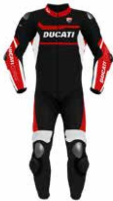
Ducati Corse |D |air® K2

The Ducati SuMisura project currently includes the following products: