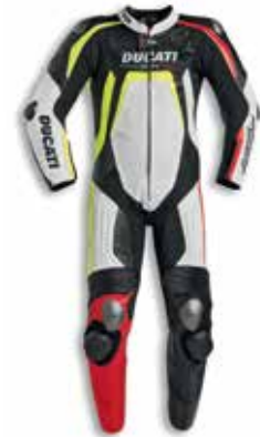
Ducati Streetfighter V4 Lamborghini only for bike owners